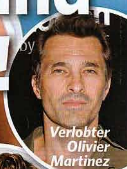
Verlobter Olivier Martinez